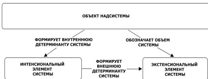
Рис. Системологическое обобщение семантического треугольника

ренней детерминантой объекта надсистемы называется фактор, формирующий запрос надсистемы на определенные, поддерживающие функции системы, интенциональный элемент системы, в котором заключена сущность, причина и смысл существования системы (ноумен, система в себе), ее содержание. Такой интенциональный элемент формирует внешнюю детерминанту системы: фактор, определяющий существенные свойства системы, форму связи и порядка элементов системы (феноменов), необходимых для выполнения функционального запроса надсистемы, объем которых определен надсистемой, как экстенциональный элемент системы (см. рисунок).